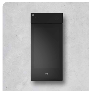
2N® IP STYLE (SUPPORTA LE TESSERE SECURED) 9157101-S